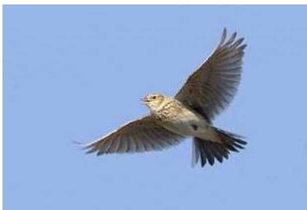
Загадка. В синем небе голосок, будто крохотный звонок (КОНОРОВАЖ)

День был весенний, один из первых теплых и солнечных дней. Местность холмистая, но открытая, без кустов. Над головой висел и заливался невидимый жаворонок. Деталей не помню – как нам ставили задачу, чего мы должны были достичь... Капитан, который нами командовал, велел надеть костюмы. С трудом и в спешке (делать все нужно было быстро, на время) мы надели комбинезоны, на сапоги – бахилы с завязками под коленом, на руки – такие же большие и грубые перчатки. Капитан особо предупредил: не забудьте подтянуть поясной ремень, под которым все это висело, а то он свалится и потеряется. После этого нужно было надеть противогаз – с непривычки даже без перчаток процедура непростая. Напялив на голову эту вонючую резиновую штуку, я убедился, что почти оглох, клапан противогаза хрипел при дыхании, заглушая все звуки. Не только жаворонка, но и капитана, который надсаживался над ухом, я слышал с трудом.