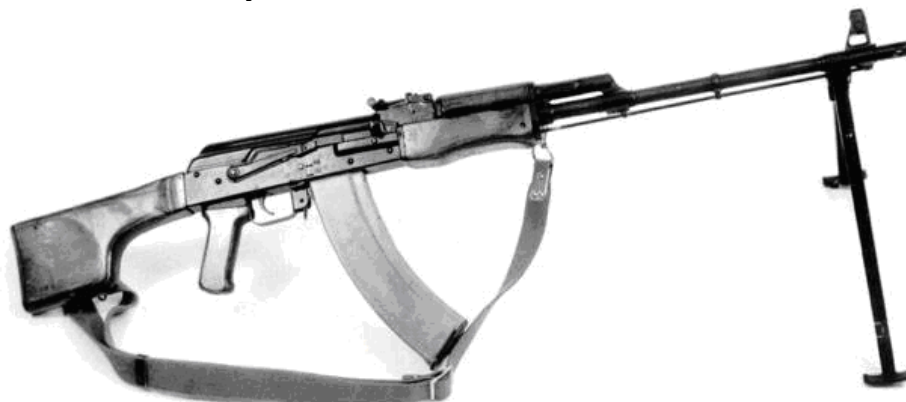
Ручной пулемет Конечно, у меня был другой, но очень похожий на этот.

Мне одному почему-то достался ручной пулемет, штука побольше и сильно потяжелее. Это его свойство я по достоинству оценил немного позже.