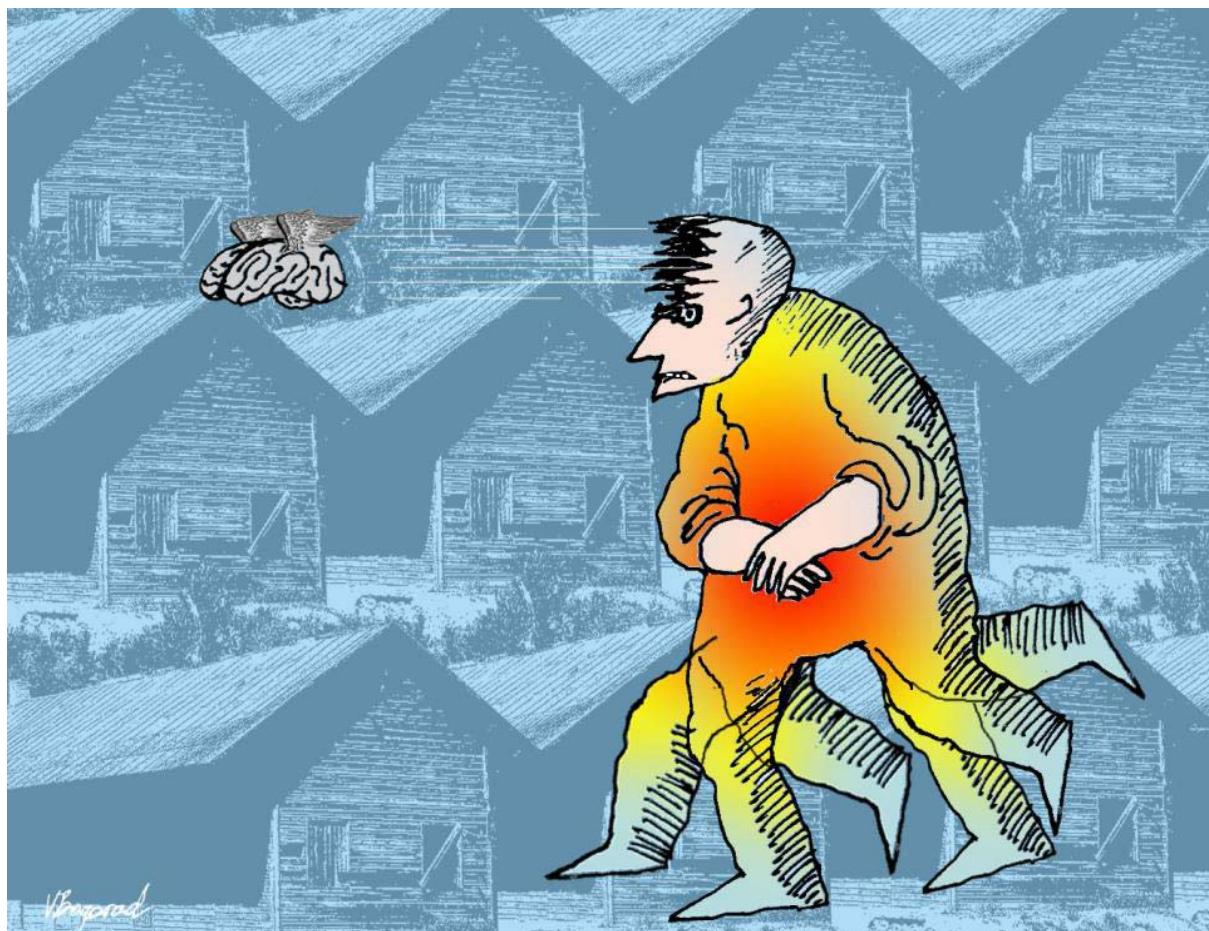
Рисунок Виктора Богорада

Владимир Герасимов gerasimovvladimir@gmail.com впервые опубликовано на сайте http://kojevnikova.ucoz.ru