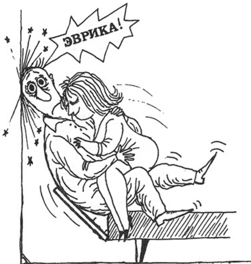
Рисунок Виктора Богорода

впервые опубликовано в журнале «ТРИЗ» 95, 1